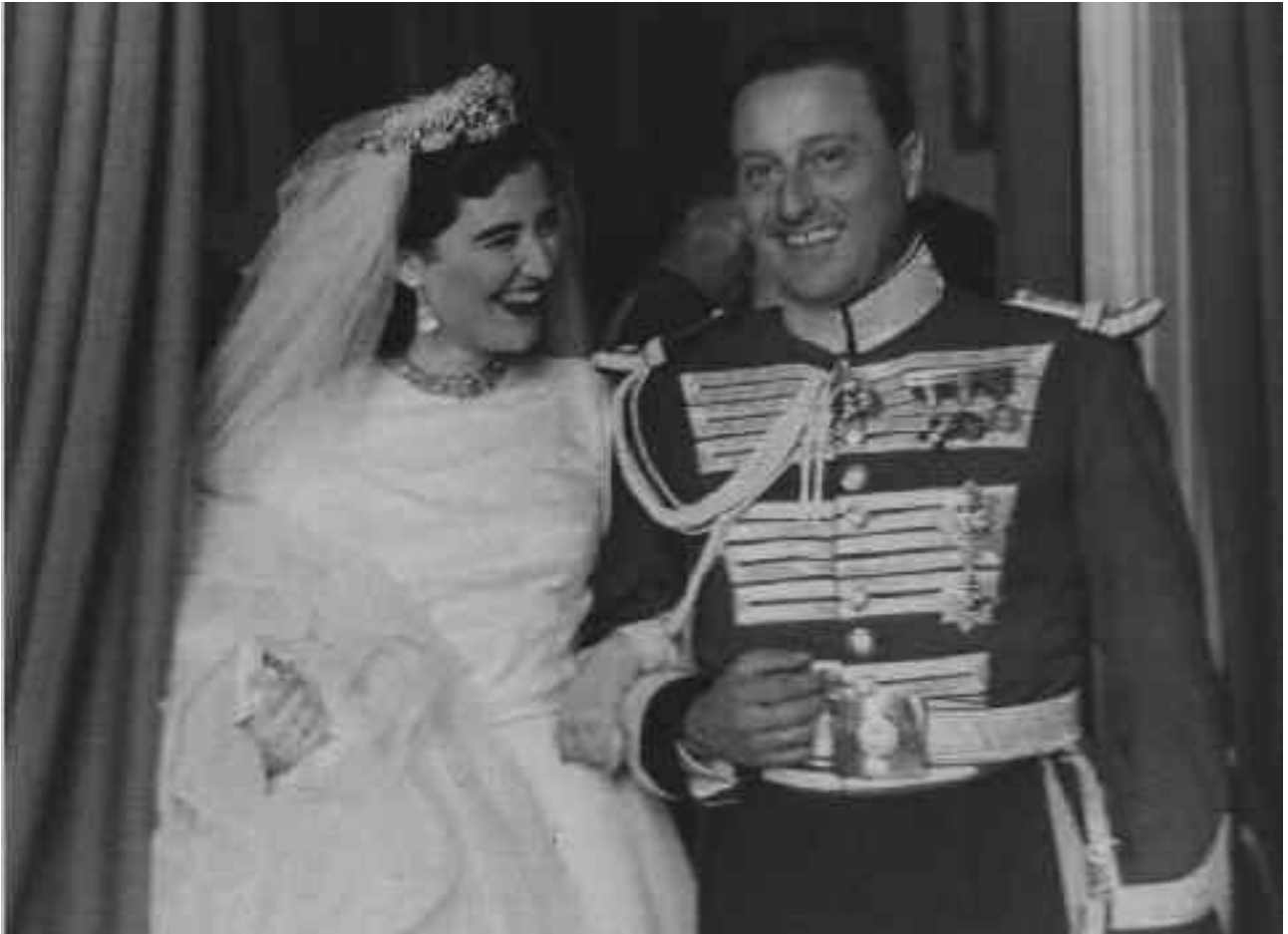
Boda de los duques de Almenara Alta, en 1948

ANDRES FÉLIX VELAZ DE MEDRANO Señor de las villas de Fuentemayor y Almarza de los Cameros