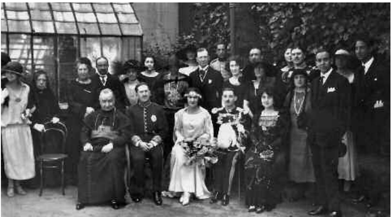
Boda de los duques de Almenara Alta, en Madrid, el 9 de mayo de 1923

ARMAS.....: En campo de oro, cinco estrellas de gules, pue- tas en aspa