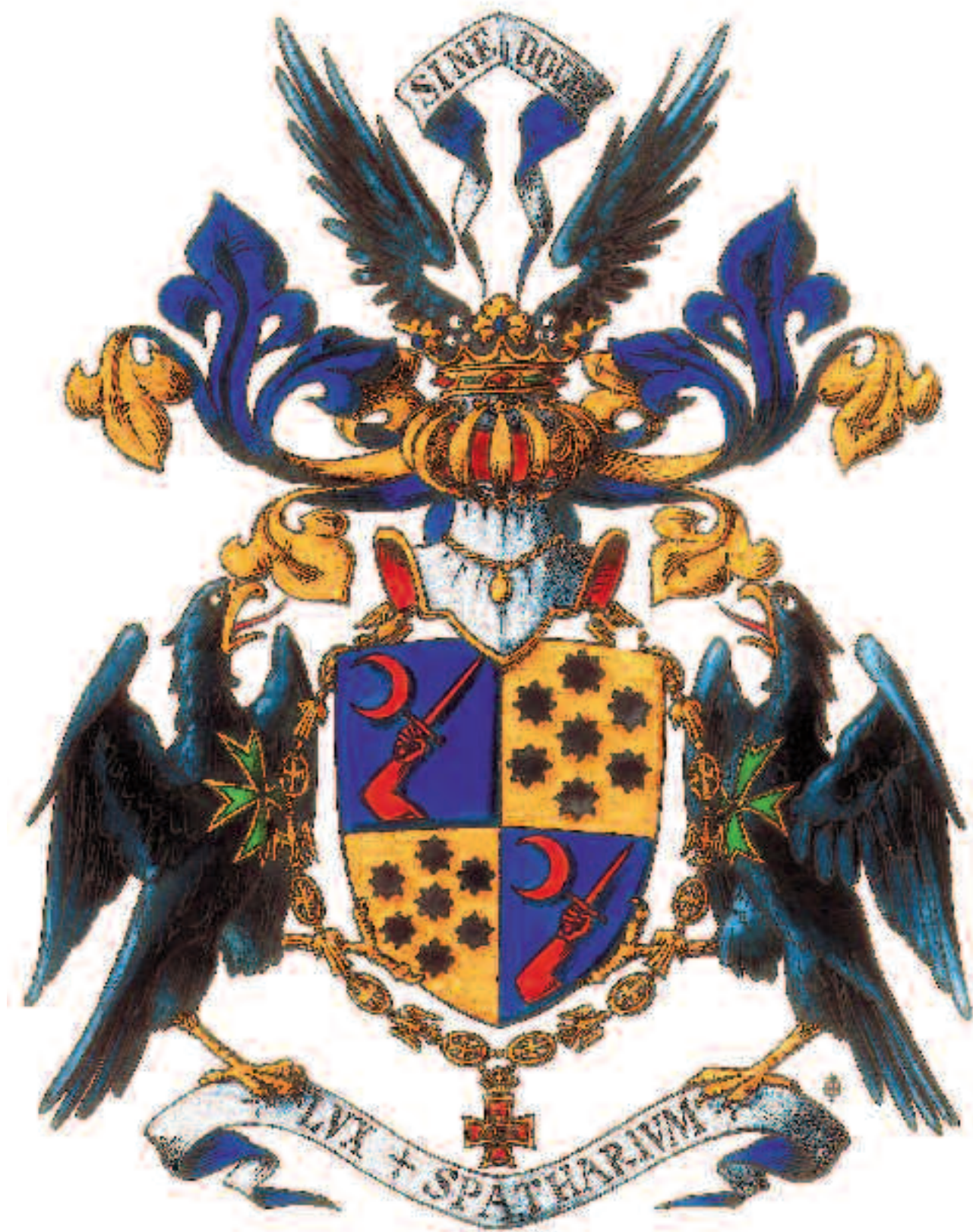
Armas del caballero don Alfredo Escudero y Díaz-Madroño, blasonadas por el Juez de Armas del Gran Priorato, don José María de Montells y Galán y dibujadas por don Carlos Navarro Gazapo.