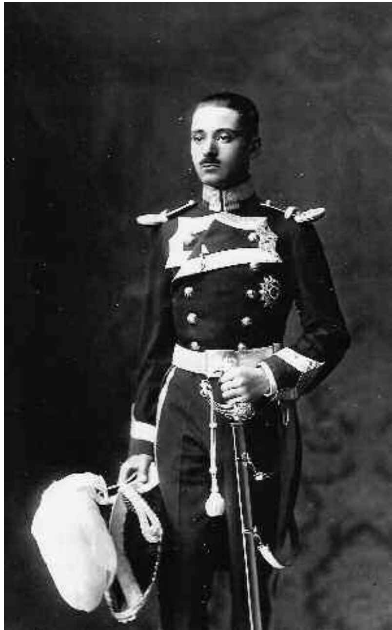
El VII duque de Almenara Alta