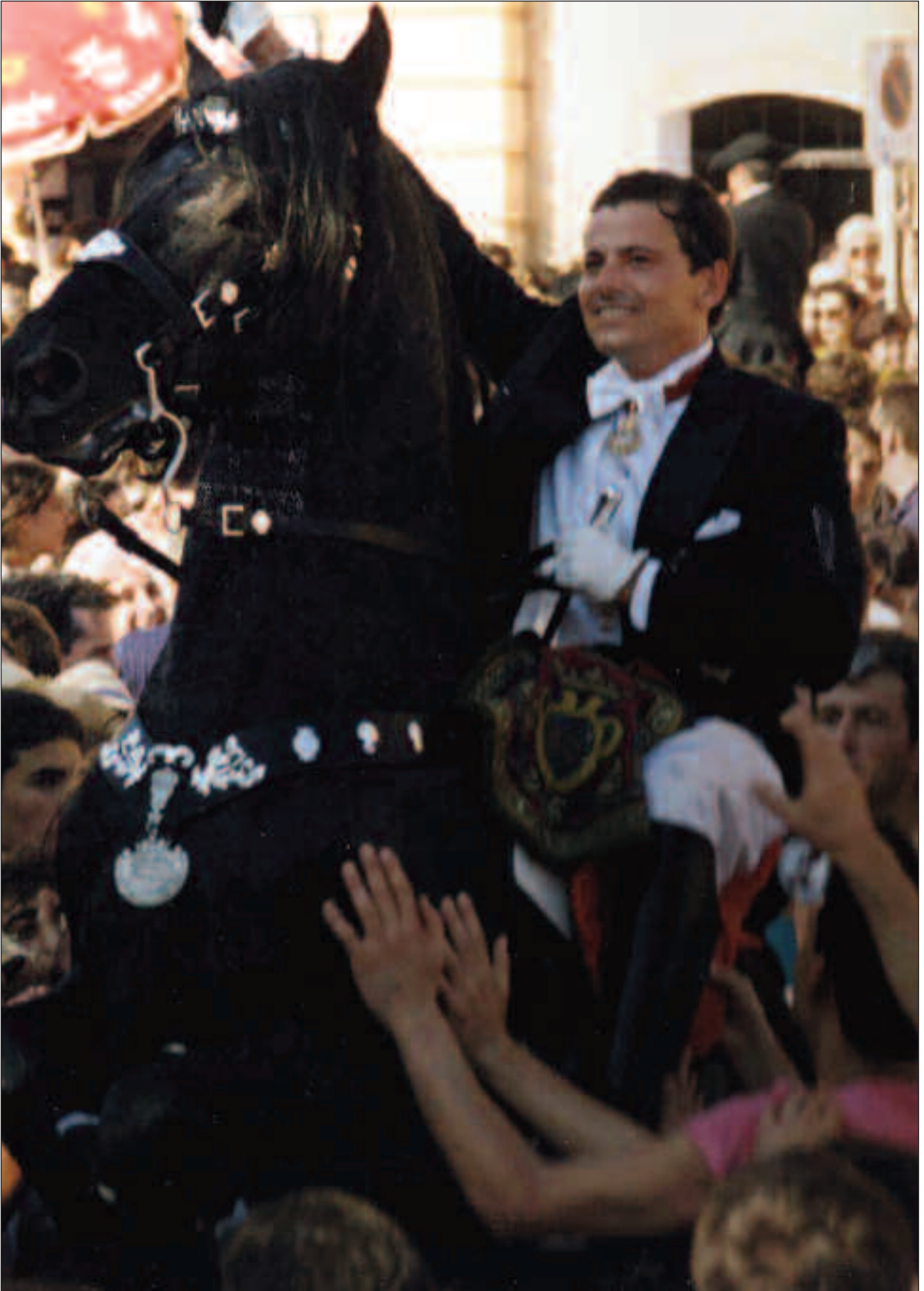
El marqués de la Lapilla, en Ciudadela, el día de San Juan.