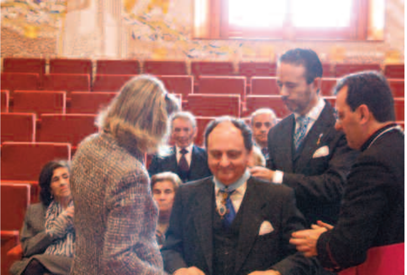
Imposicion de la venera del Cuerpo de la Cobleza de Asturias al Gran Maestro