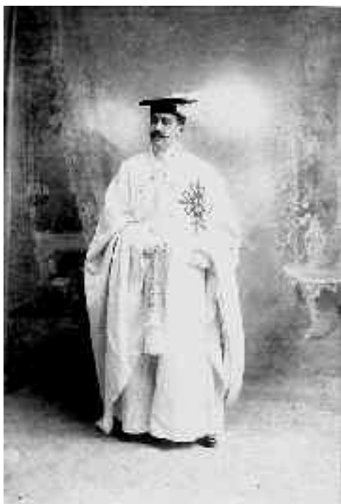
El Conde de Puerto Hermoso