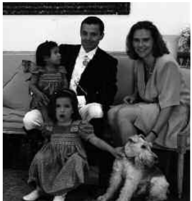
Los marqueses de la Lapilla.

Grande de España XIII Marqués de Lapilla (1901) Marqués de Vilhel Conde de Darnius Maestrante de la Real de Valencia Caballero de la Orden de Calatrava (1879) Nació en Ciudadela (Menorca) el 21 de Di- ciembre de 1847 Falleció en Madrid el 16 de Febrero de 1909