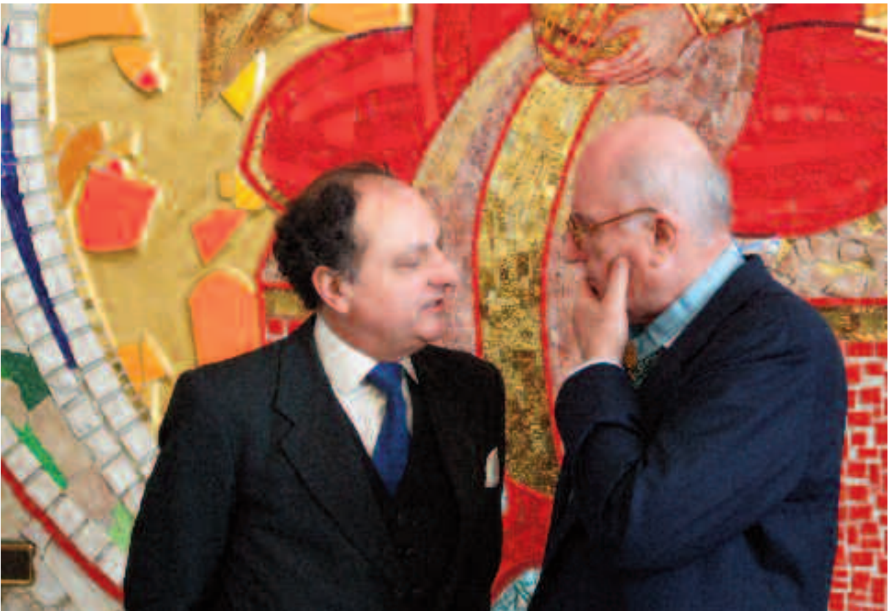
El Gran Maestro con el Archiduque don Andres Salvador