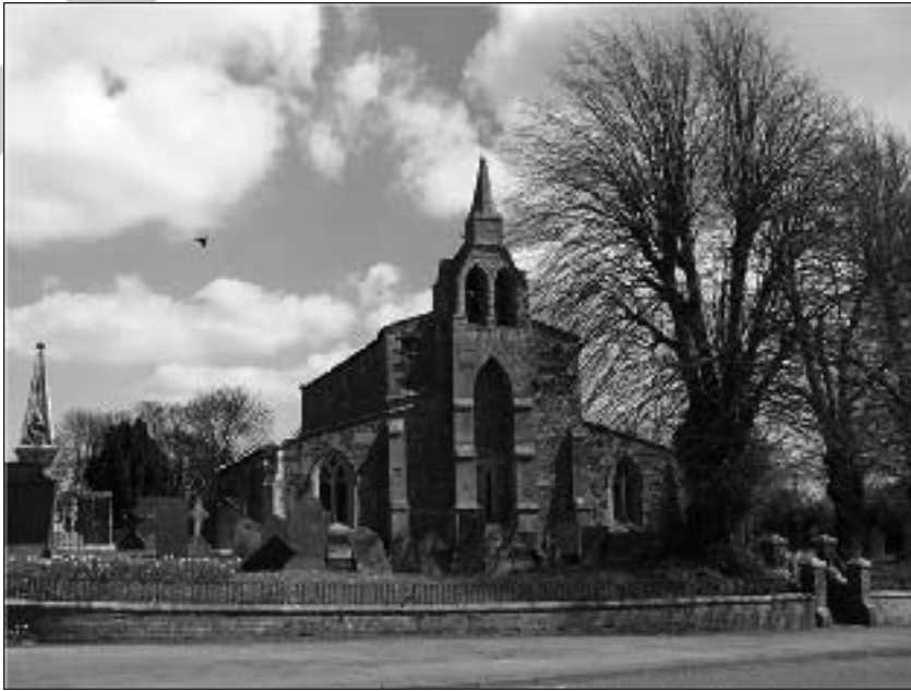
Iglesia de Burton Lazars.

como se los permita le enfermedad. Recomendamos además y ordenamos que como esto fue ordenado y dicho por siempre en los hospitales, cada hermano leproso debe cada día decir como deber por la mañana, un Padre Nuestro y un Ave Maria trece veces y para las otras horas del día...respectivamente un Padre Nuestro y un Ave Maria siete veces, etc... Si un hermano leproso secretamente falla en la realización de estos artículos, deben consultar al párroco de dicho hospital para que se le imponga una penitencia" (Dugdale, " Monasticon Anglicanum ", II, 390).