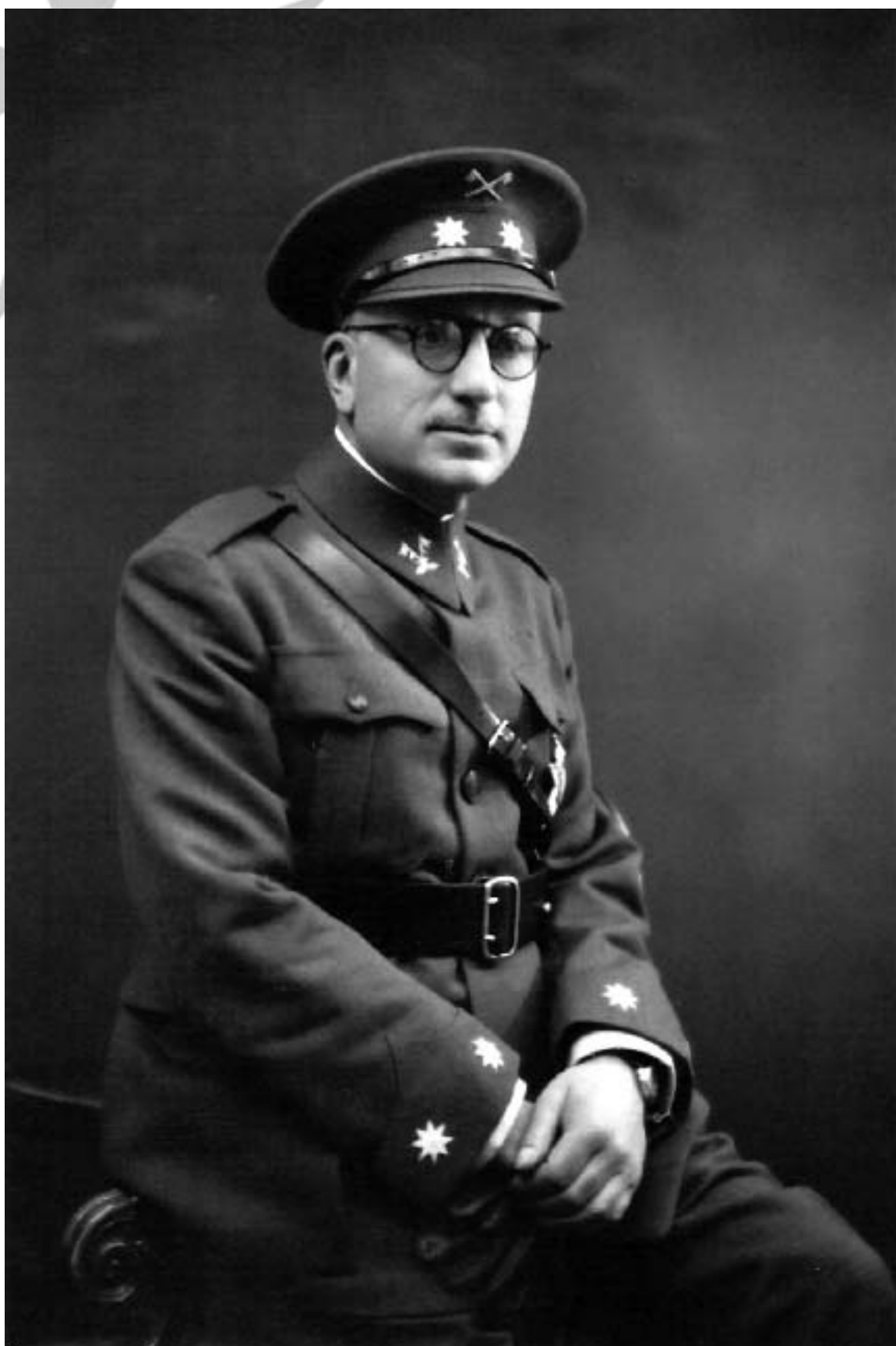
El II Duque de Santa Elena de Teniente Coronel de Caballería.