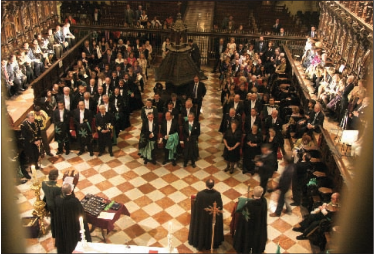
Vista General del Coro de la Catedral.