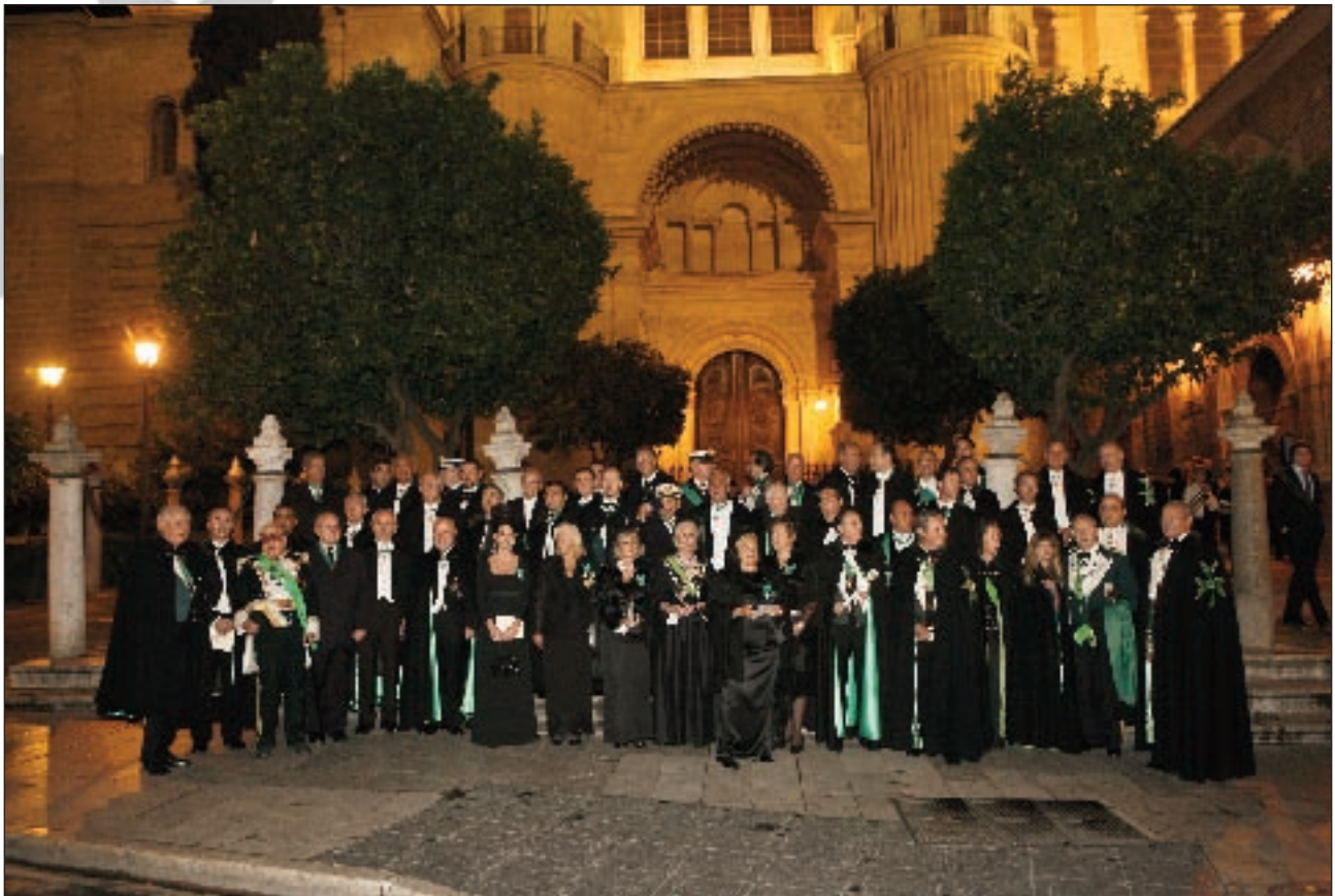
Grupo de los caballeros y damas ingresados junto al Gran Maestre y autoridades a la salida de la Catedral.