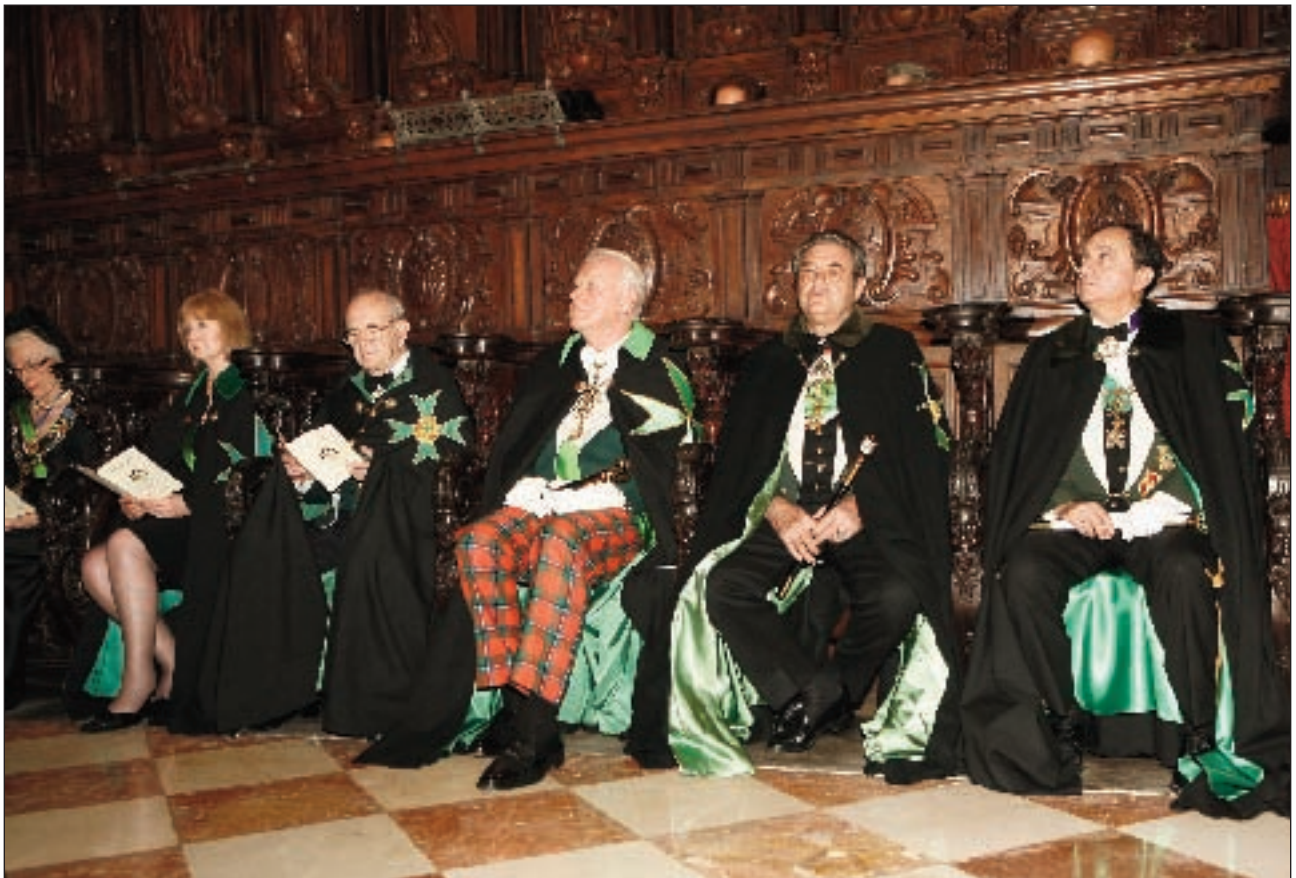
Autoridades de la Orden.