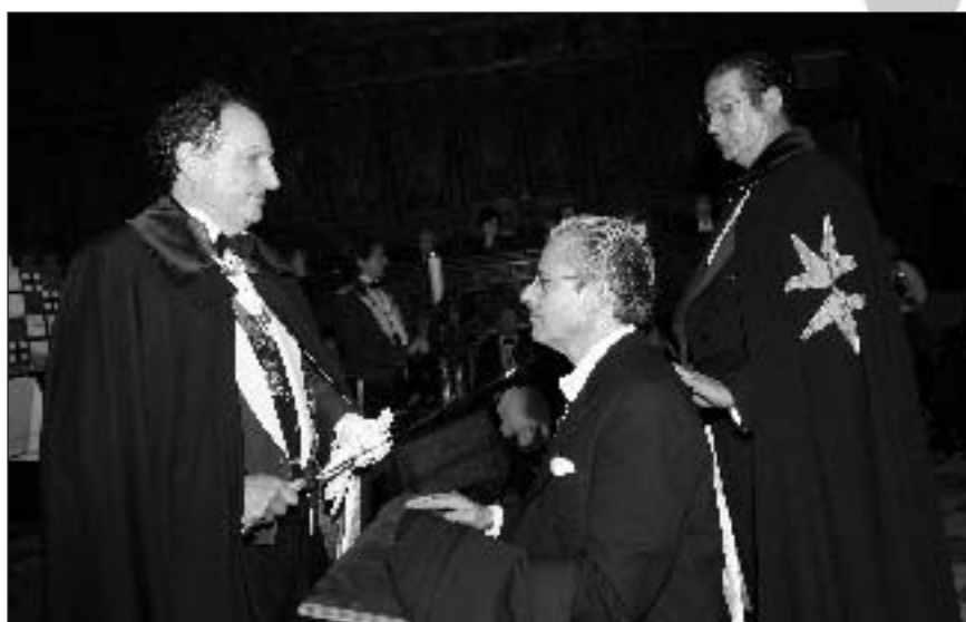
Investidura del Marqués de la Lapilla, apadrinado por el Duque de Santoña.