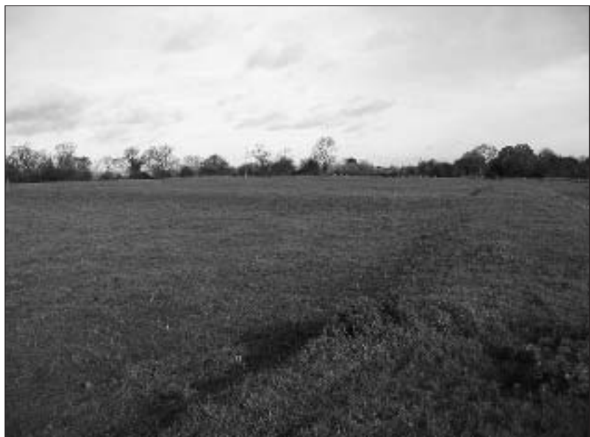
Lugar donde estuvo enclavada la antigua leprosería de Burton Lazars

Yo no transgrediré los límites impuestos a mí, sin licencia especial de mis superiores, y con su consentimiento y voluntad; y si yo probara una ofensa contra alguno de los artículos citados arriba, es mi deseo que el Señor Abad o su sustituto puedan castigarme acorde la naturaleza y la cuantía de la