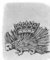
Cominus et Eminus!

De fait, il y a très peu de documents dans les archives